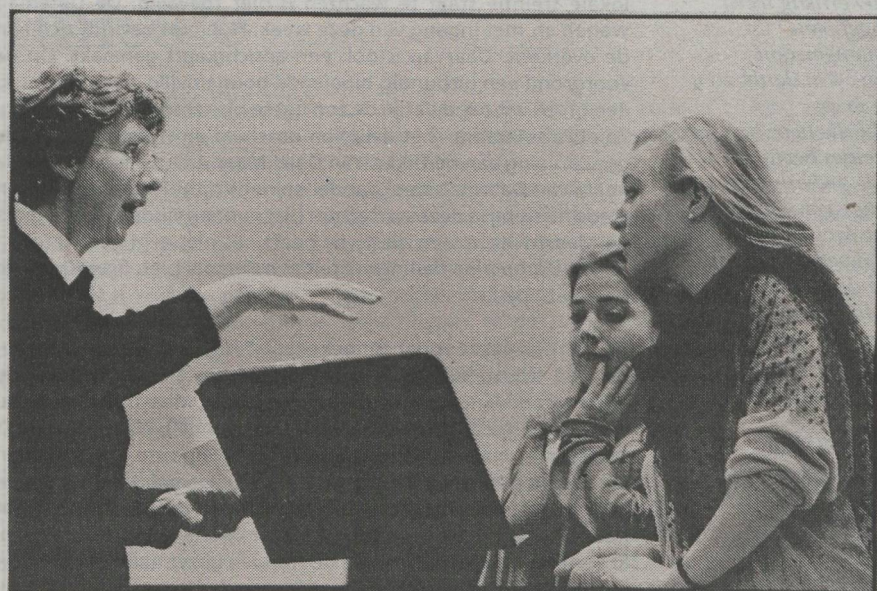
"Als je niet weet waarover je zingt, kan je het beter laten."

Twee zangeressen uit Mexico en Griekenland zingen een duet van Henry Purcell dat drie eeuwen geleden op diens eigen begrafenis werd gespeeld. De Engelse vindt dat er in de uitvoering teveel invloeden uit de 19e eeuw zijn terug te horen. Teveel vibrato en versieringen. "Probeer de laat-