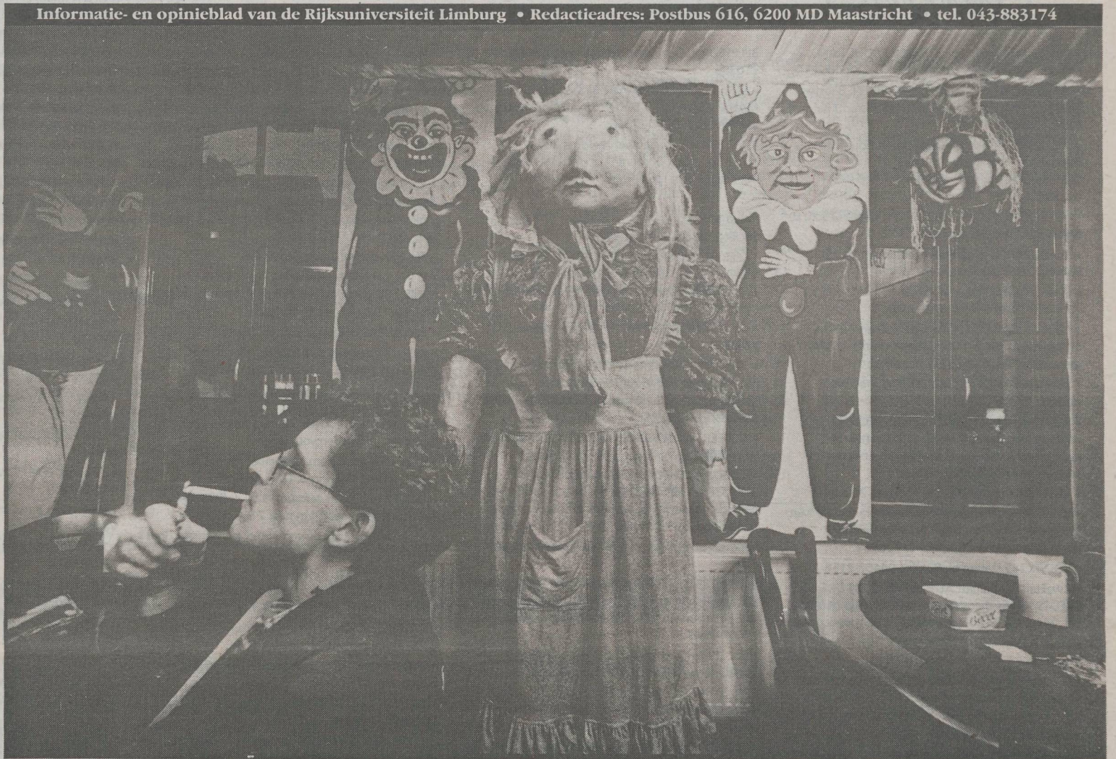
Het vrouwmens Wielemösj staat weer veilig in de kroeg. Zie pagina 4

De Datema's van boekhandel Arcadia: op weg naar een land van melk en honing.