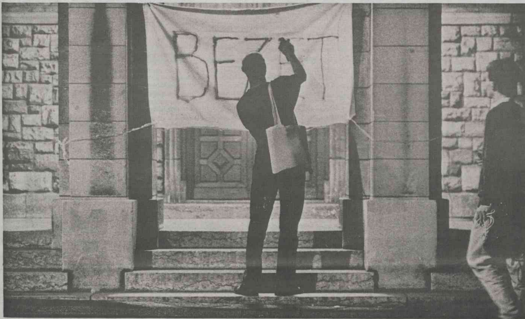
Maandag 24.00 uur. Het bestuursgebouw aan de Bouillonstraat is al een uur bezet door de actiegroep MUB=PET. En het zal nog wel even duren, klinkt het op dat moment enthousiast. "We gaan pas als onze eisen door het college van bestuur zijn ingewilligd. Wat we doen als de politie voor de deur staat? Dan vertrekken we ook. We willen geen rotzooi."

Informatie- en opinieblad van de Universiteit Maastricht • Redactieadres: Postbus 616, 6200 MD Maastricht • Jaargang 17, 12 september 1996