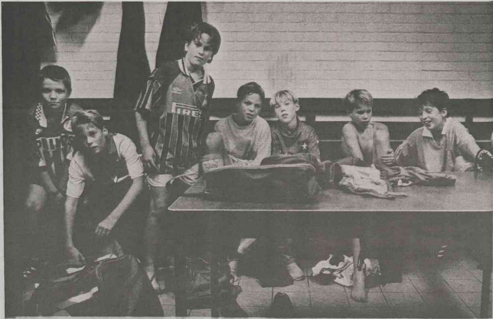
De jeugd van Sint Pieter, de eerste zorg van de club bovenop de berg