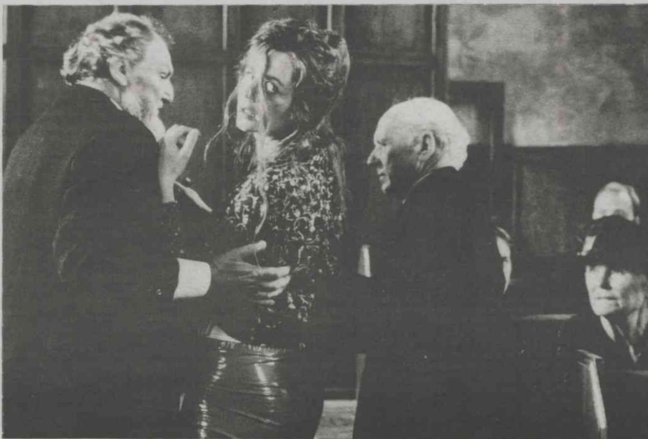
Bess uit 'Breaking the waves'

De Deen Lars von Trier heeft met Breaking the waves een melodrama gefilmd en de Grand prix de jury in Cannes binnengehaald. Het is het verhaal van een grote liefde die, volgens de regels van het genre, geen happy end kent. De film is in zijn geheel uit de hand gedraaid, waardoor het fictieve verhaal waar gebeurd lijkt. Zoals in meer recente films, bijvoorbeeld Zusje of Kutzooi , speelt de filmmaker met de conventie van de documentaire. In eerste instantie word je draaierig van de alsmaar bewegende camera, maar het effect van deze cameravoering is dat je je als toeschouwer temidden van de gebeurtenissen bevindt. Het drama wordt hierdoor versterkt en er ontstaat een enorme betrokkenheid met de personages. Met Bess eigenlijk, want zij is degene die zich, oprecht en ontwapenend, onweerstaanbaar aan je opdringt. Door subtiele, kleine details haarscherp te laten zien, weet de filmmaker te ontroeren. In de intimiteit die Von Trier hiermee heeft opgeroepen schuilt de kracht van Breaking the waves . Bess leeft in een eenzaam dorpje in de Schotse hooglanden, waar de ouderlingen de scepter zwaaien en waar Gods woord wet is. We schrijven begin jaren zeventig. Met groot wantrouwen stemt men in met het huwelijk tussen Bess en Jan. Deze grote liefde is een Deen die op het booreiland voor de Schotse kust werkt. Hij is een buitenstaander, een man