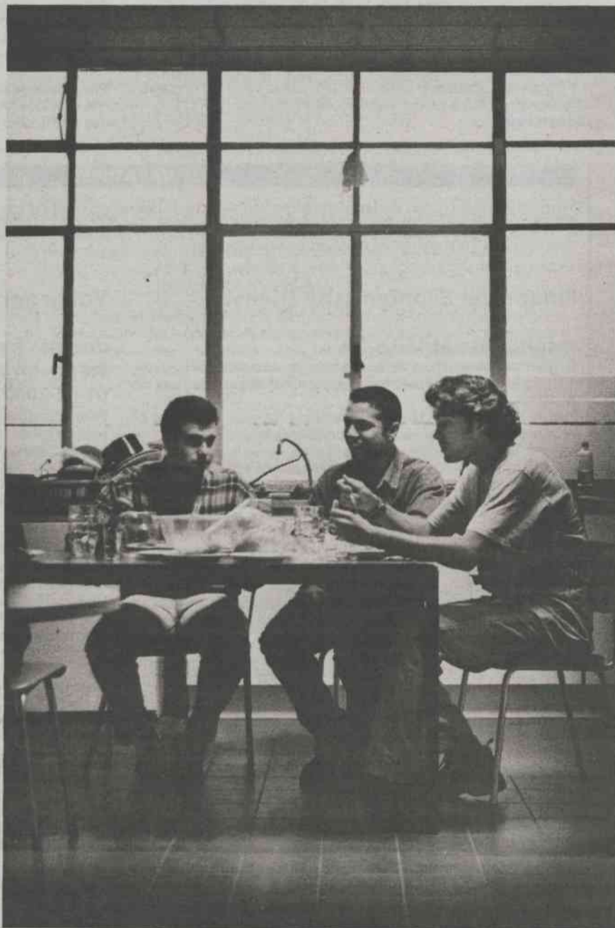
Het eetclubje van Annadal, tweede verdieping

Gebier is een stugge jongen met borstelwenkbrauwen en dito haar. De voertaal is Engels, maar vooralsnog is er geen sprake van een sprankelende conversatie. Ik mag gaan zitten aan een van de lege tafels in het midden van de keuken. Terwijl Gebier verder aan de sla plukt vertelt hij dat deze gang 6 Spanjaarden, 1 Duitser, 1 Japanner, 1 Pakistaanse Schot, 1 Nederlander, 1 Belg en 2 Fransen herbergt. Eten die mensen nooit? Gebier kan alleen voor de Spanjaarden spreken: die eten laat, vanaf negen uur, daarom is er