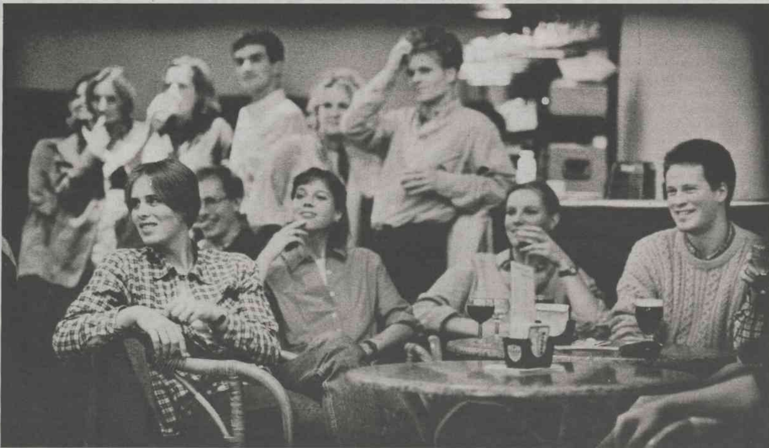
Voorzichtig lachen om de debaters