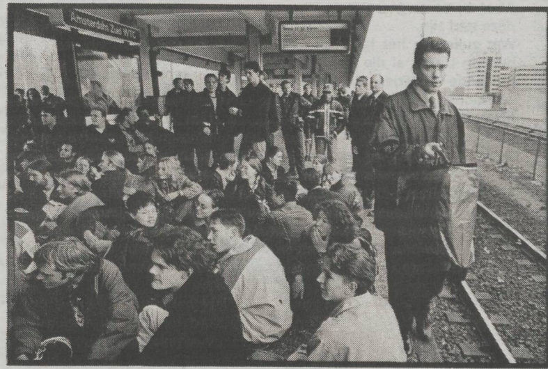
Actie voor behoud van de OV-kaart. Station bezet, maar treinen bleven rijden

Met een twee uur durende bezetting van station Amsterdam Zuid hebben studenten vorige week vrijdag het startsein gegeven voor een reeks acties tegen bezuiniging op de OV-Studentenkaart.