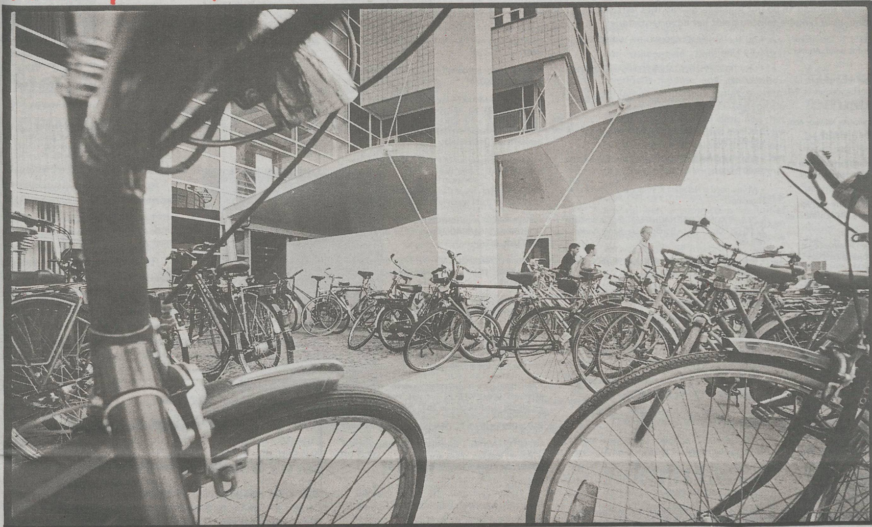
Vroege bezoekers van de Dr. Tanslaan vinden een paar uur later hun fiets totaal ingeklemd tussen een kluit van veelal studentieke vervoersmiddelen. Een fietsstalling laat nog even op zich wachten

Informatie- en opinieblad van de Universiteit Maastricht • Redactieadres: Postbus 616, 6200 MD Maastricht • Jaargang 18, 23 april 1998