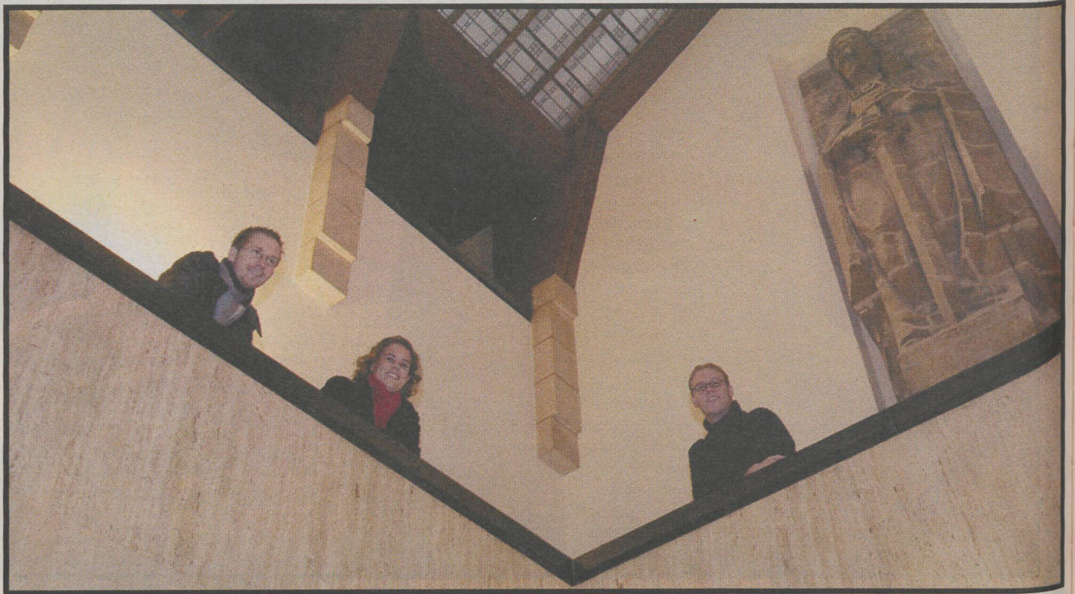
Studenten Rechtsbureau Maastricht: eerste hulp bij huurproblemen

Na elke scheet regent het tegenwoordig aanklachten en claims. Niemand is meer veilig voor advocaten op strooptocht. Maar waar kan de student naar toe als deze zijn huisbaas in de verkoop wil doen of onder het huurcontract uit wil komen?