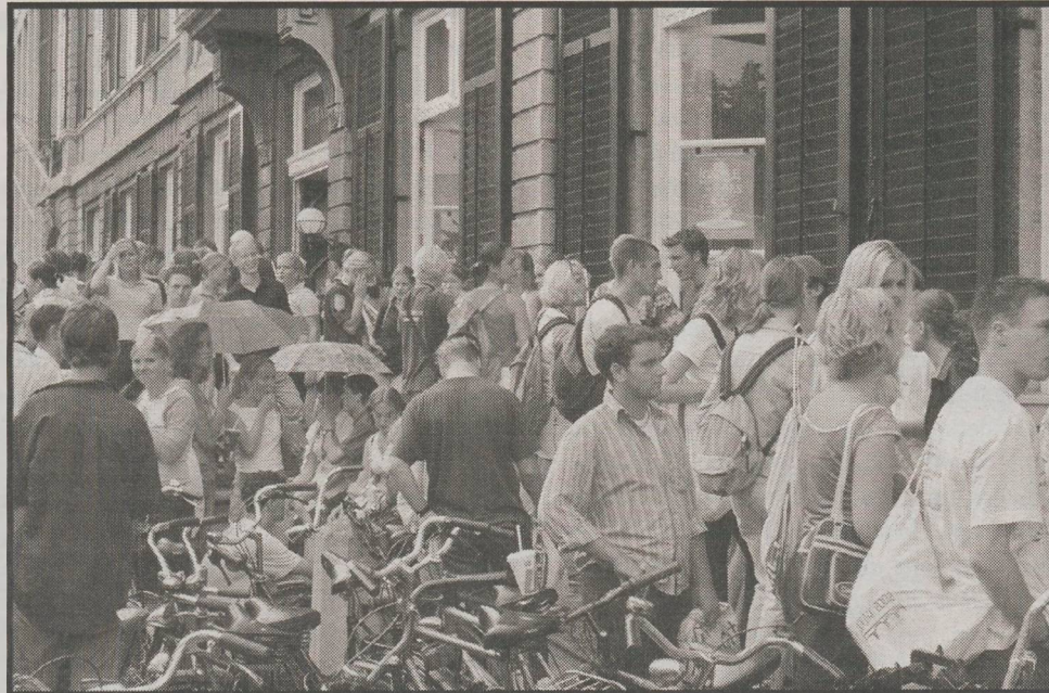
Studenten hebben recht op goed onderwijs

In 1995 is het dienstenverdrag GATS ( General Agreement on Trade in Services ) van de Wereldhandelsorganisatie (WTO) in werking getreden. Volgens de EU-handelscommissie is het doel van GATS duidelijk: "It is first and foremost an instrument for the benefit of business." Oftewel: de grenzen openen in nagenoeg alle dienstensectoren en internationale handel bevorderen. Dit betekent dat handelsbarrières zoals subsidies en 'versturende' wetten en regels weggehaald moeten worden. En wat zijn diensten? Denk aan banken, toerisme of telecommunicatie, maar ook diensten, die traditioneel tot de publieke (en dus beschermde) sector horen zoals onderwijs en gezondheidszorg, zullen onder GATS vrij verhandelbaar zijn.