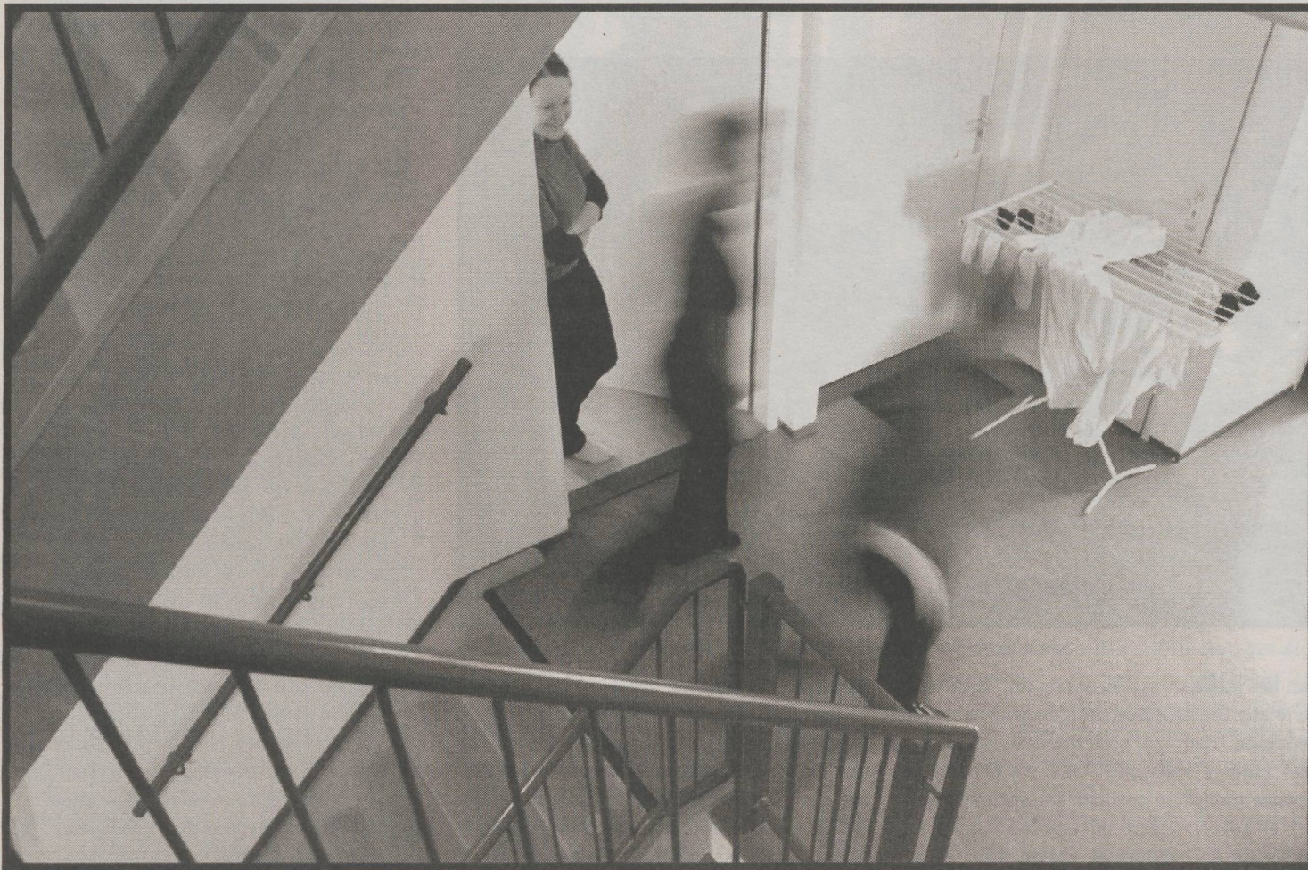
"I don't see any sense in being in a place for students when you are not a student anymore"

Minister Kamp of public housing wants graduates to move out of their student houses, to ease pressure on the limited supply of student accommodation.