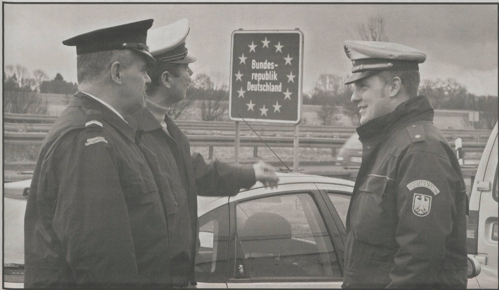
Juristen maken zich zorgen over de mensenrechten met het oog op het Europese aanhoudingsbevel