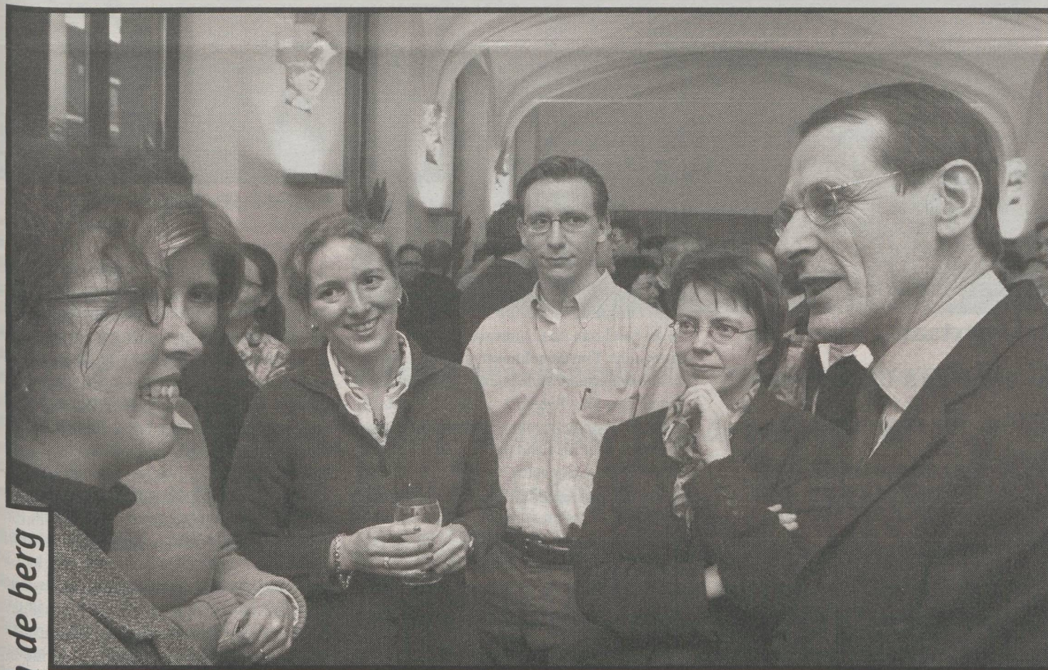
Beklim de berg