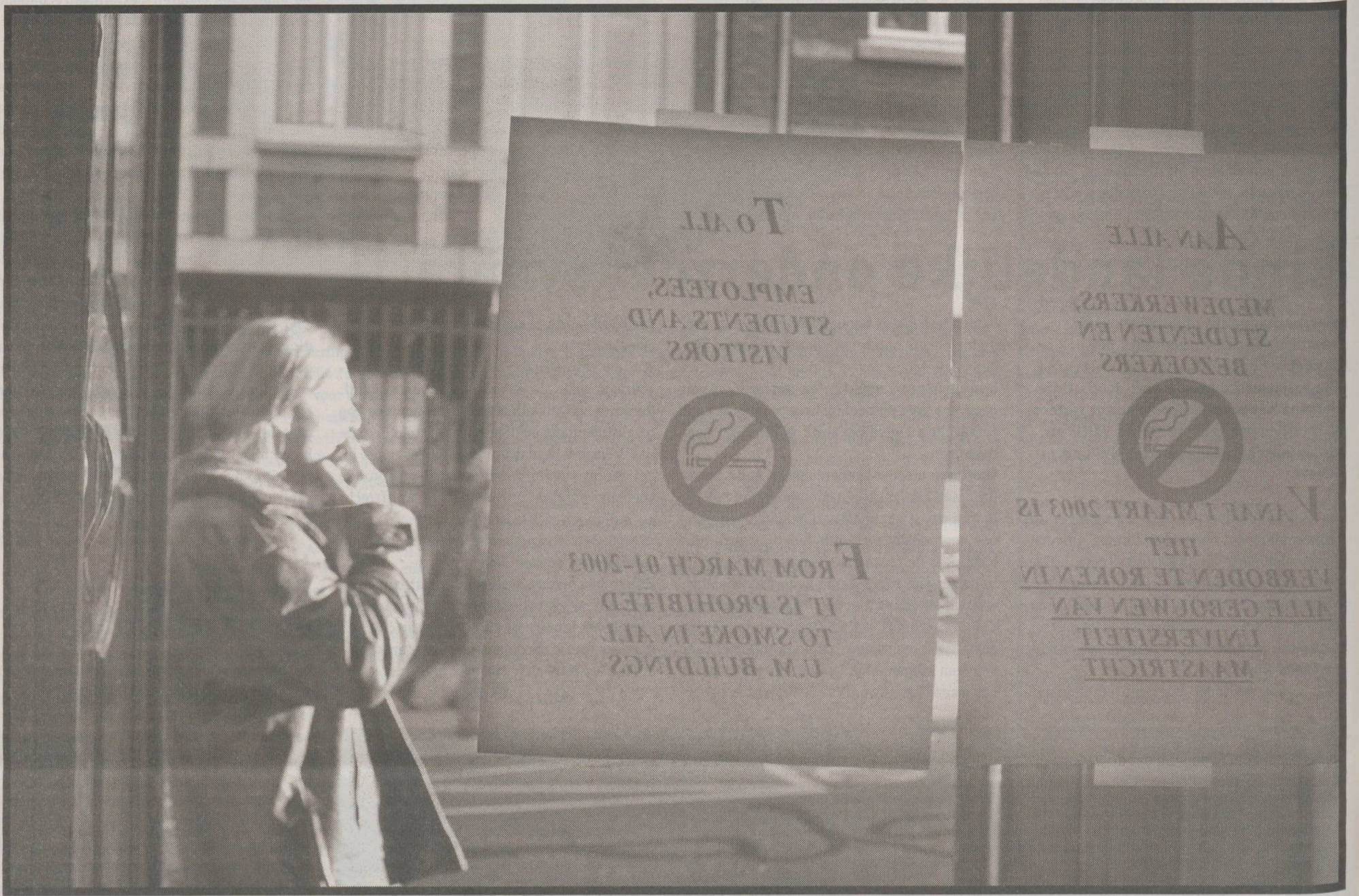
Buiten in de kou even roken

Op 1 maart is het zover, dan moet de tabakslucht uit de universitaire gebouwen verdwenen zijn. Een aantal fervente rokers zal voortaan meer thuis gaan werken, zo klonk het al eerder in Observant . Anderen vrezen moeilijke tijden, maar weigeren om te stoppen. "Ik laat me niet dwingen door het college van bestuur."