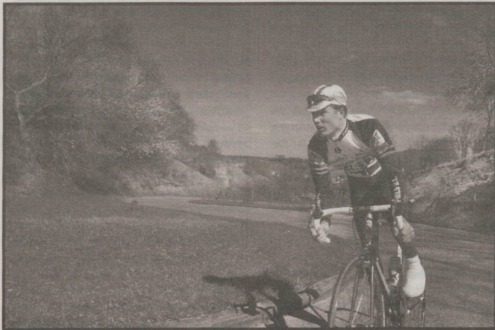
Een voorliefde voor "trajecten waarop iedereen stuk gaat"

De overgang van twintig uur sporten per week tot bijna niets meer, is enorm. Hij mist het zeker, maar de teleurstelling is erger. "Ik heb er niet alles uit kunnen halen. Ik dacht alleen maar: wat als mijn sportcarrière hier