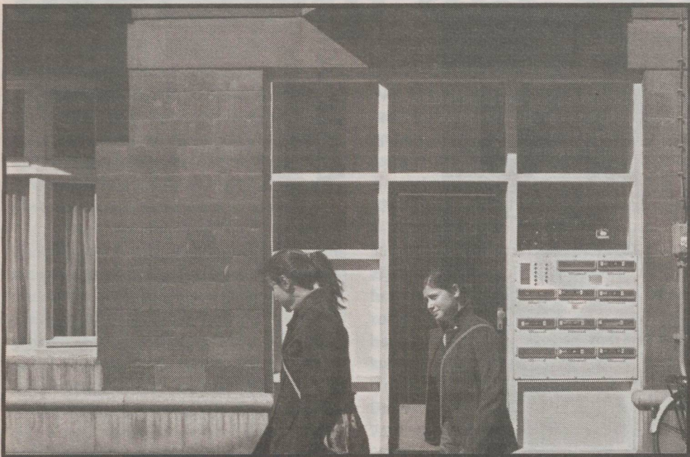
A lot of first year students are registered at a false address

Nearly 5000 Dutch first year students are registered at a false address: many in order to get a higher study grant, others because they are forced by their landlords who would otherwise lose their welfare benefits.