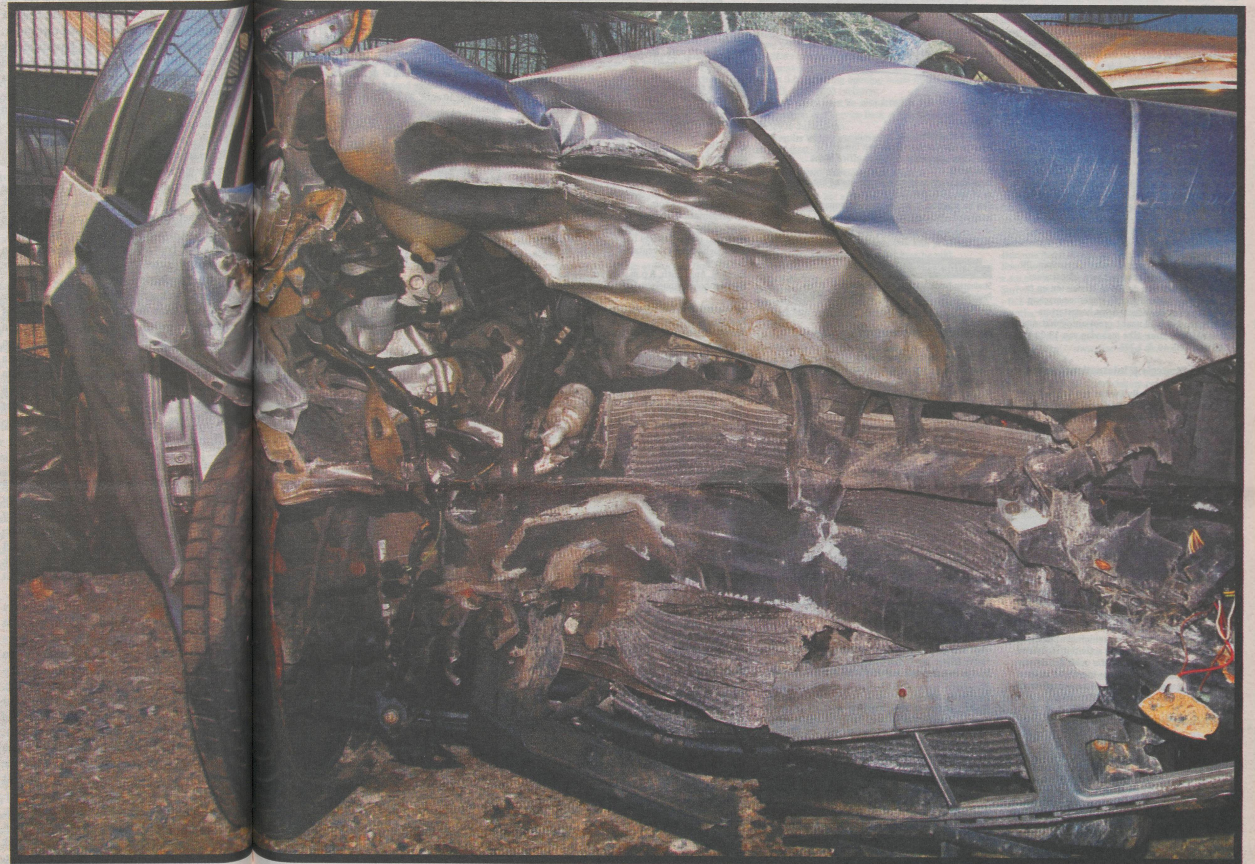
Hoe ingrijpend de gebeurtenis ook is, het geheugen spreekt nooit de hele waarheid

Uit die experimenten mag dan blijken dat emo-