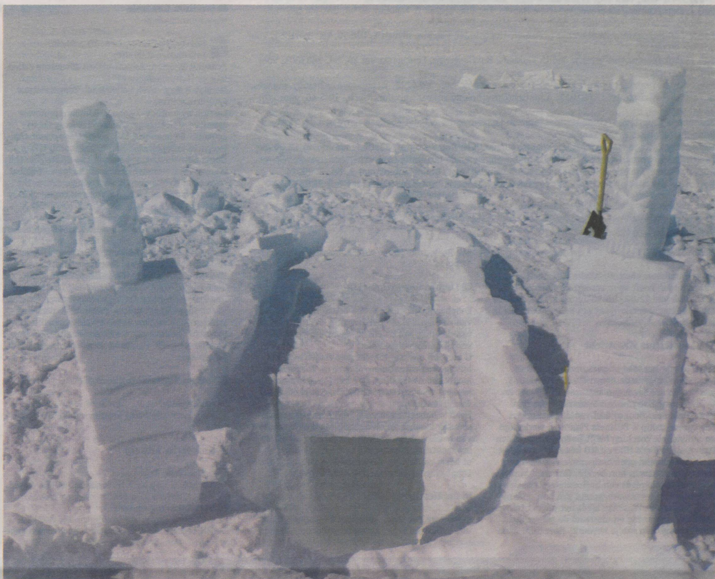
Een snow shelter waarin reizigers schuilen tijdens sneeuwstormen