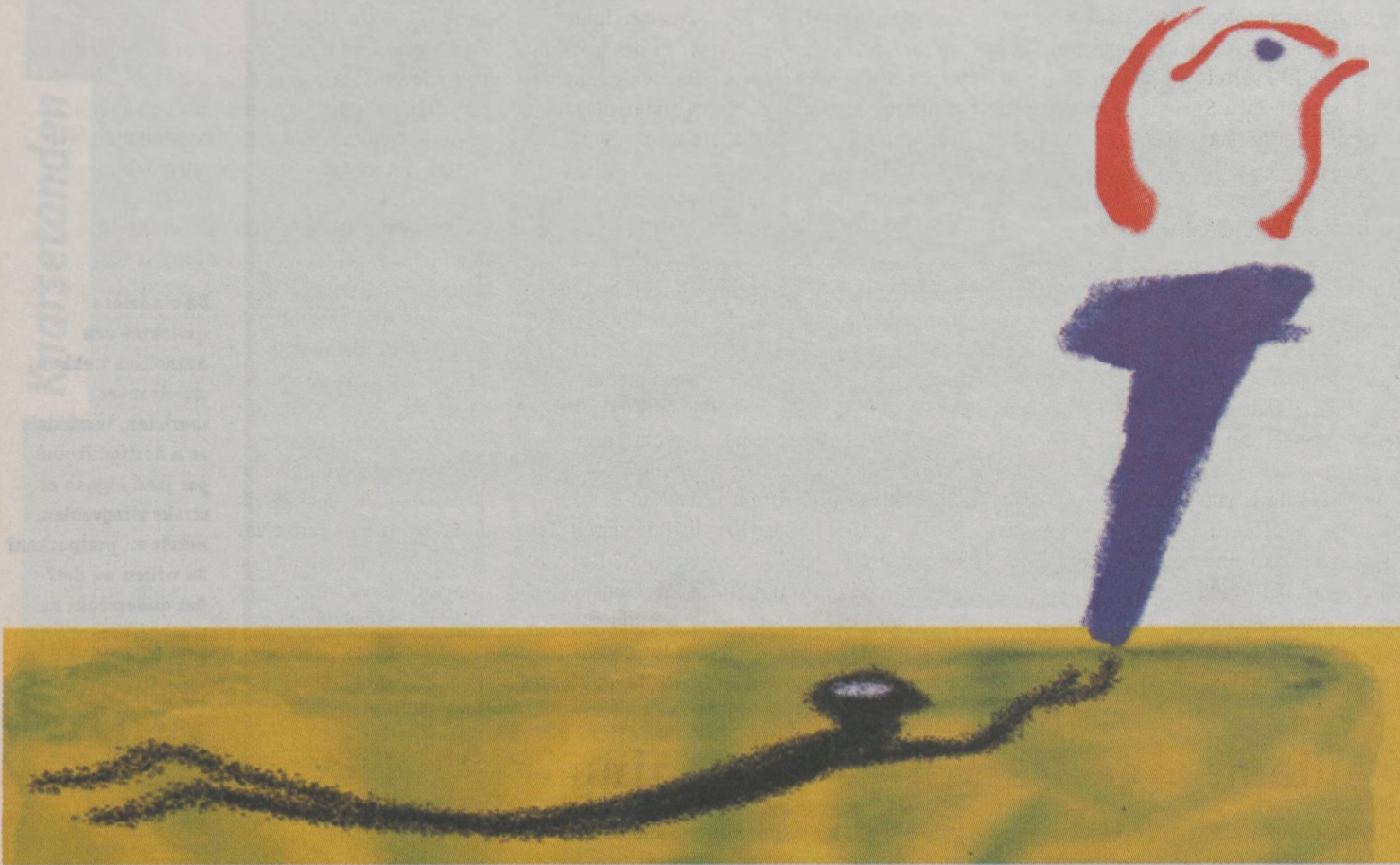
Illustratie: Toussaint Essers

Om acht uur vanavond herdenkt Nederland haar slachtoffers van de Tweede Wereldoorlog. Treinen rijden twee minuten niet, winkels sluiten hun deuren en veel gemeenten organiseren een herdenkingsbijeenkomst. Wat betekent 4 mei voor studenten en medewerkers van de Universiteit Maastricht?