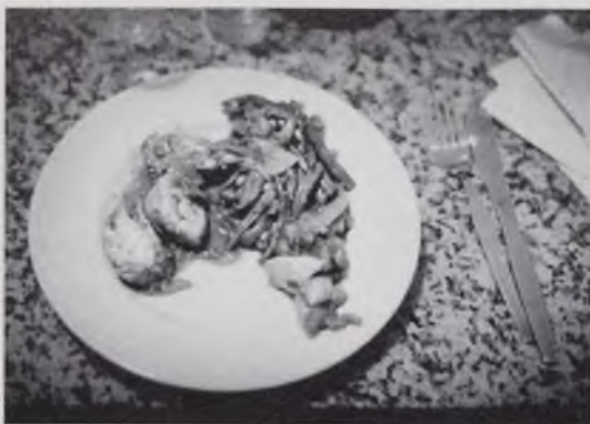
Varkenshaasje met Gorgonzola-saus en sperzieboontjes