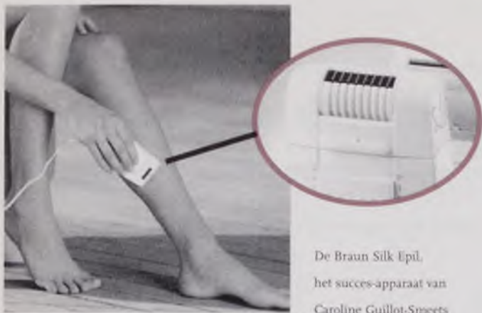
De Braun Silk Epil, het succes-apparaat van Caroline Guillot-Smeets