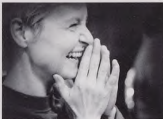
Inge Bovens

zijn meestertitel. "Heel handig als je in het management zit." "Dat was het leuke van studeren in Maastricht," vult Janssen aan. "De praktijkgevallen, leren hoe mensen communiceren. Maar je hebt wel een stevige dosis mensenkennis nodig om alle juridische vaardigheden in de praktijk te brengen. Zo'n practicum Onderhandelen voorzag daar een heel eind in."