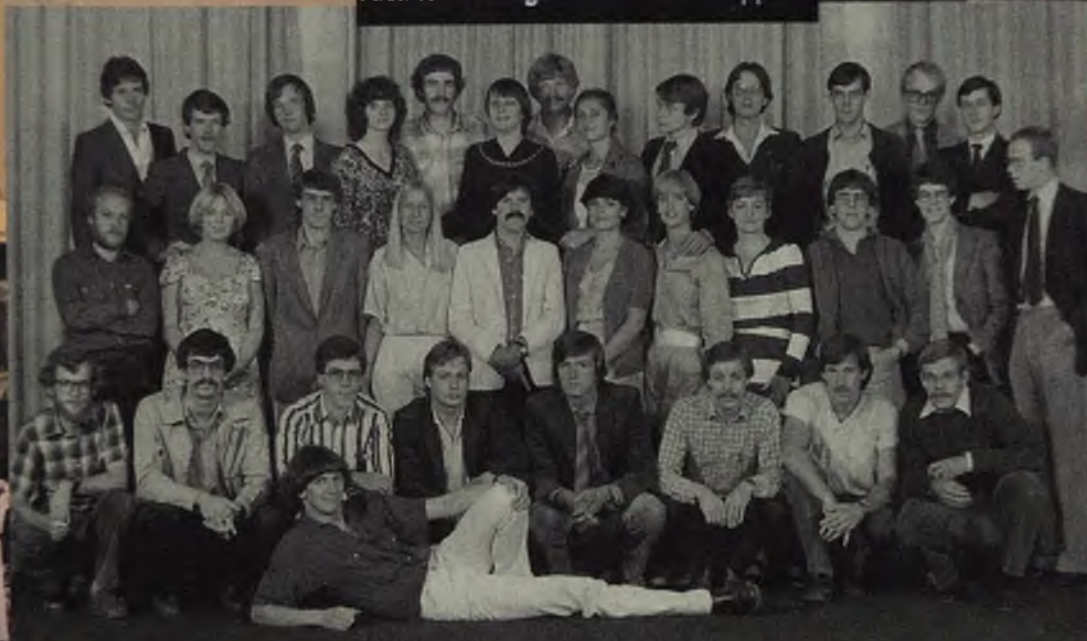
Faculteit der Geneeskunde