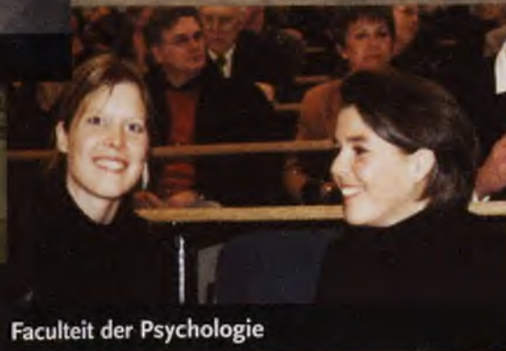
Faculteit der Psychologie