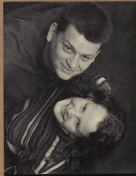
Faculteit der Algemene Wetenschappen