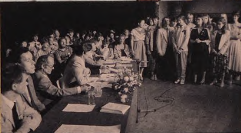
Faculteit der Gezwondheidswetenschappen