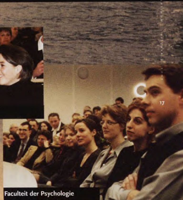
Faculteit der Psychologie