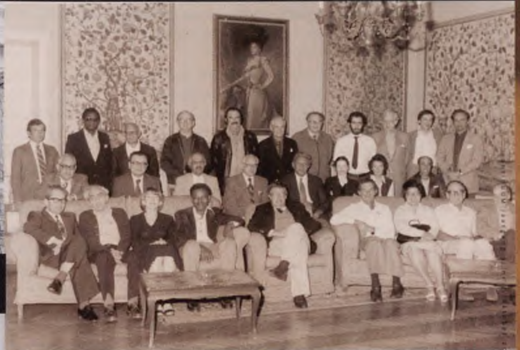
Eerste officiële bijeenkomst van de Network of Community Oriented Educational Institutions for Health Sciences in Bellagio, Italië, 1980