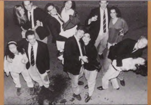
Integratie van buitenlandse studenten, 1992