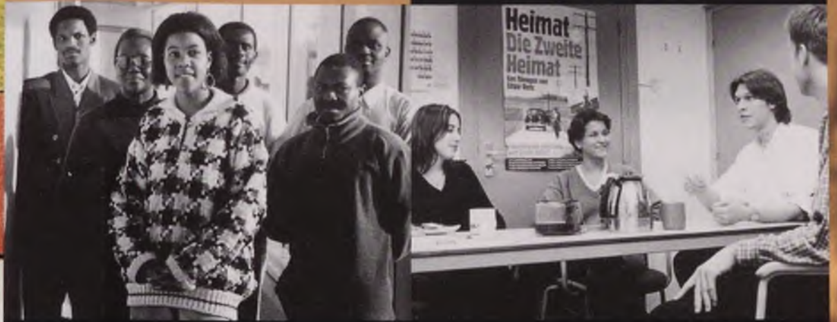
Afrikaanse studenten in Maastricht, 1995