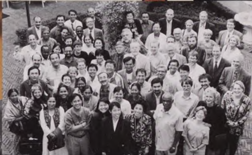
Summer Course, staf en deelnemers, 1989