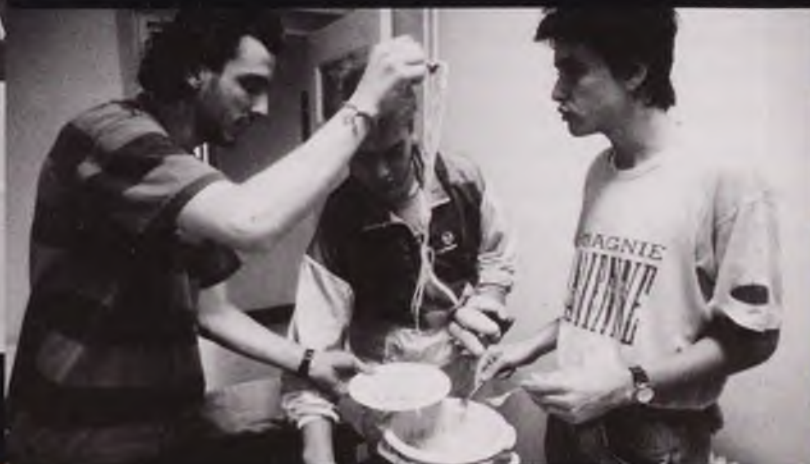
Buitenlandse studenten bereiden hun maaltijd, 1992