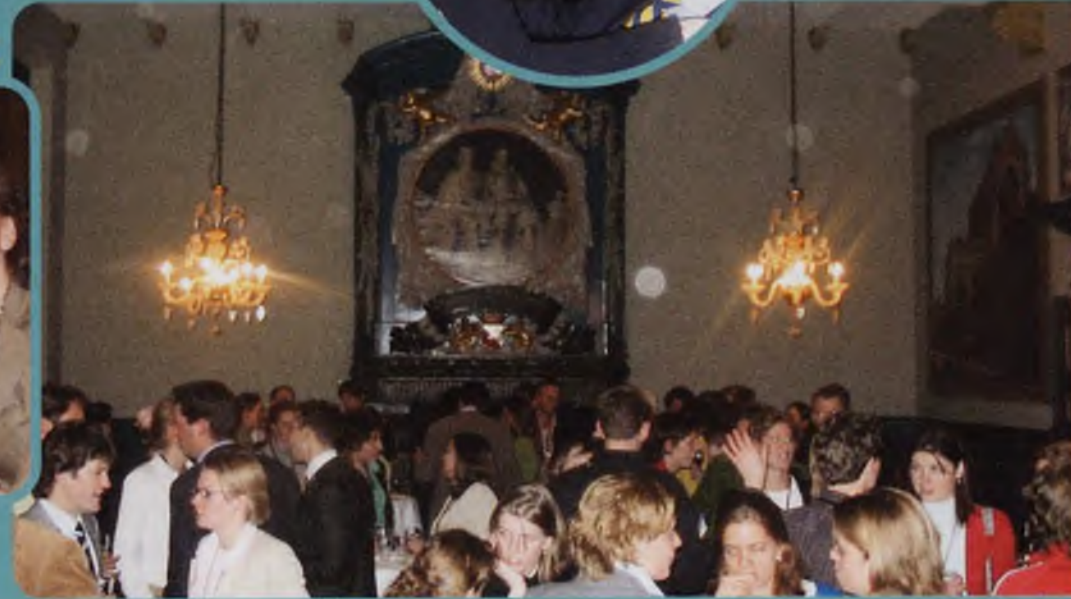
Alumnibijeenkomst Amsterdam: 9 december 2004