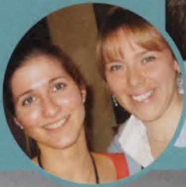
Alumnibijeenkomst Brussel: 29 november 2004