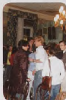
Impressies van de World Wide Alumni Meeting: "sfeervol en zinvol"