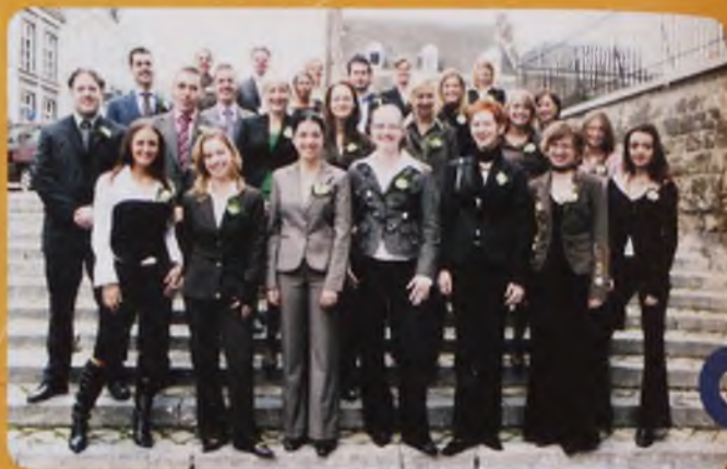
De nieuwe masters van de Faculteit der Rechtsgeleerdheid.