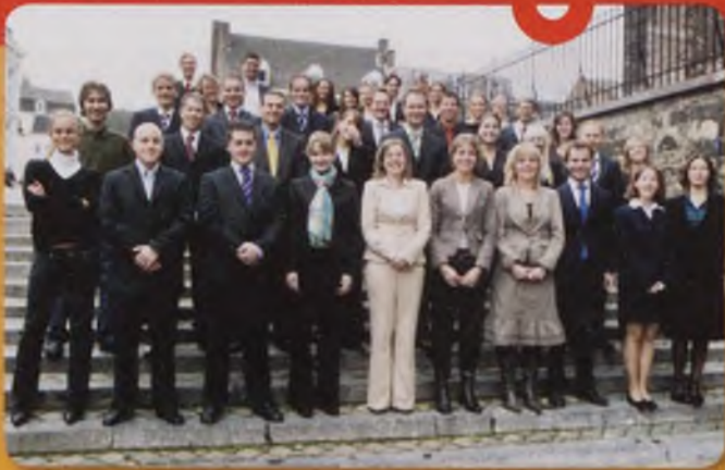
De twee groepen bachelors van de Faculteit der Rechtsgeleerdheid.