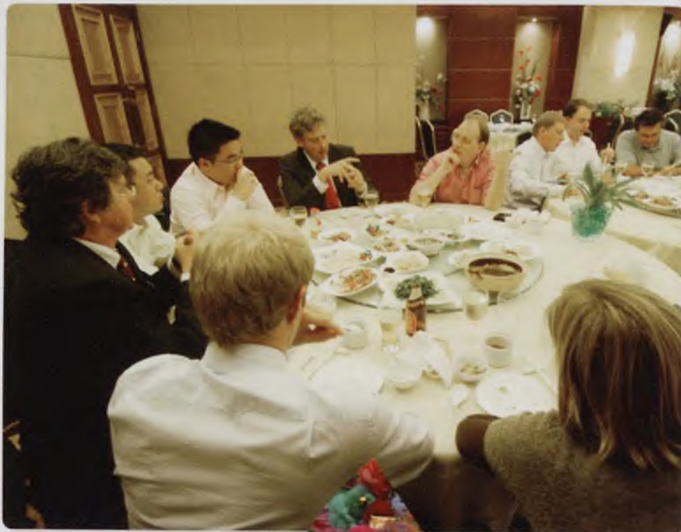
Diner met alumni in Beijing

Het koesteren en stimuleren van talent, het creëren van kansen voor vernieuwend onderwijs en onderzoek dat internationale en maatschappelijk relevante thema's centraal stelt; dat zijn de kernwaarden die de UM uitdraagt. De Universiteit Maastricht is een Europese universiteit die in haar opleidingen en onderzoekprogramma's over grenzen heen kijkt. Op het gebied van internationalisering wordt daarom voortdurend verbeterd en vernieuwd. Een voorbeeld daarvan vormt het concept van de doellanden.