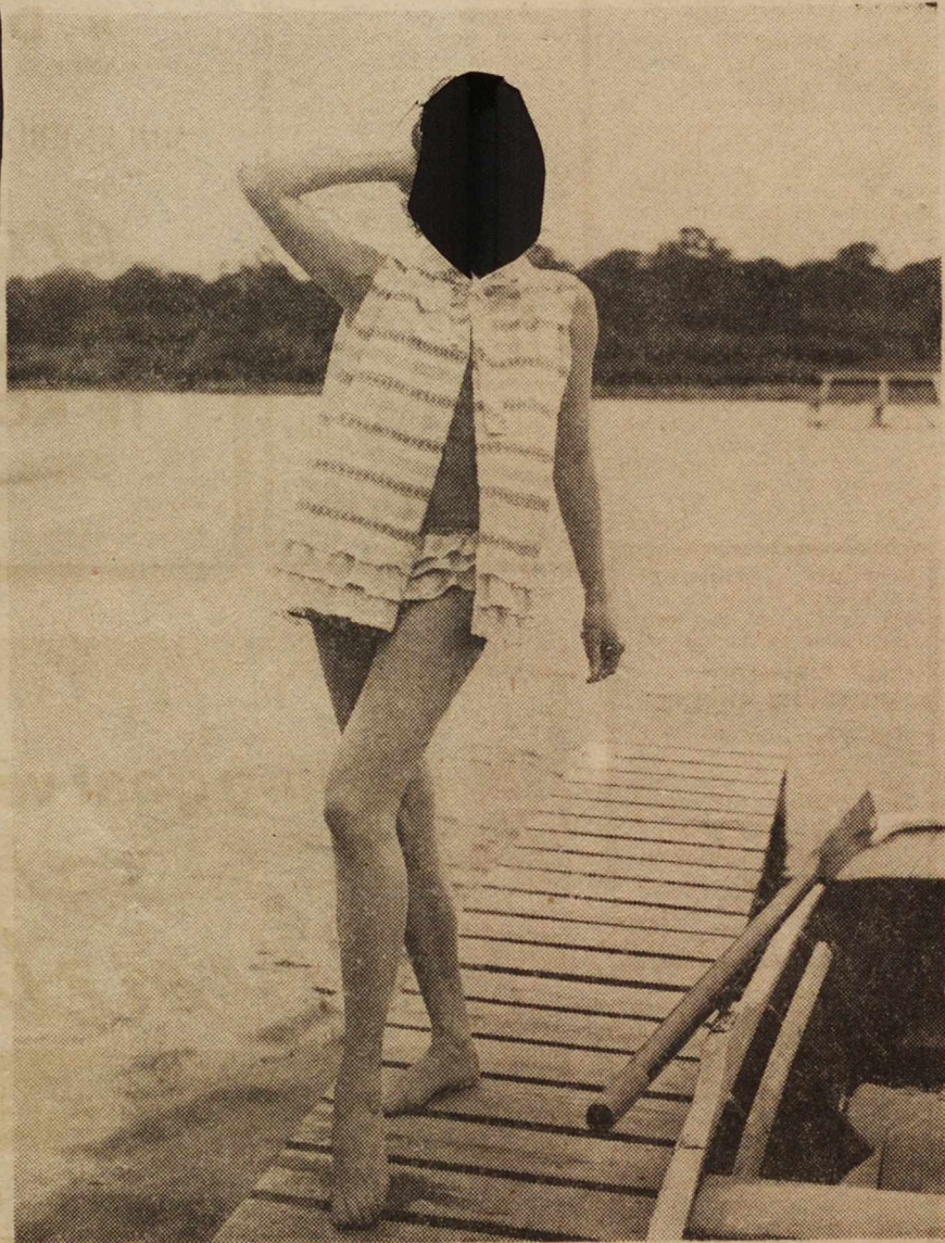
Dit grappige strandensemble is een model van Boussac. Het kreeg de gezellige naam „Samba”.