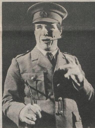
Generaal Edwards inspecteert op 23 april in Maastricht de troepen.

Amsterdam waar hij de „Friends Roadshow” opzette. Het jaarlijkse „Festival of Fools” dat nog steeds een creatieve bijenkorf is met een magische aantrekkingskracht op