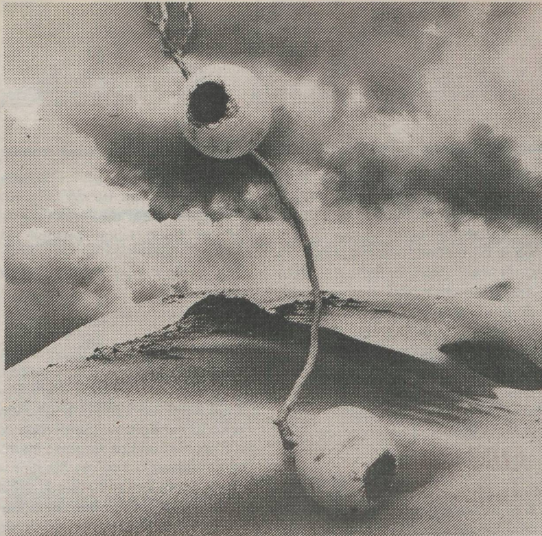
Guill. Banser: zonder titel