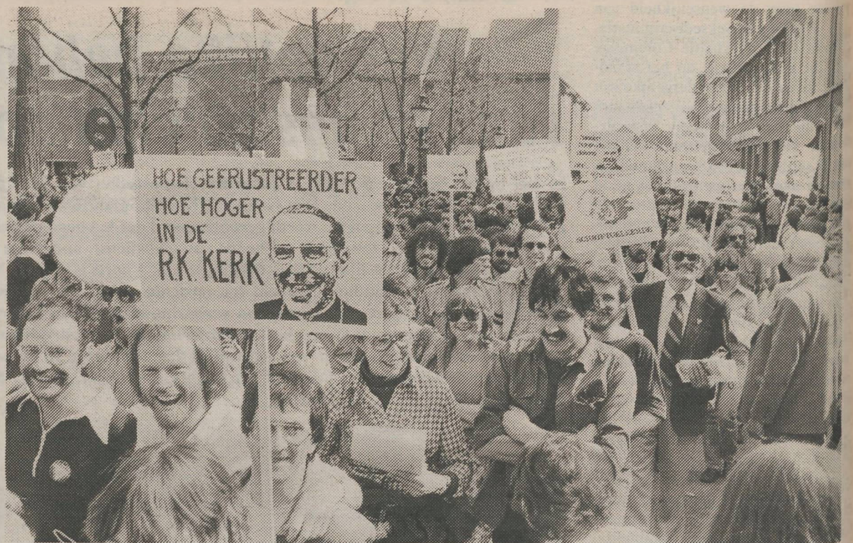
Enkele jaren geleden nog werd het als een zeer grote doorbraak beschouwd dat homo's massaal de straat opgingen in Roermond om te protesteren tegen de discriminerende opvattingen van de aldaar zetelende bisschop.

Het feit dat er nog volop wordt gediscrimineerd en het feit dat er in de opvattingen een vrij grote steun is