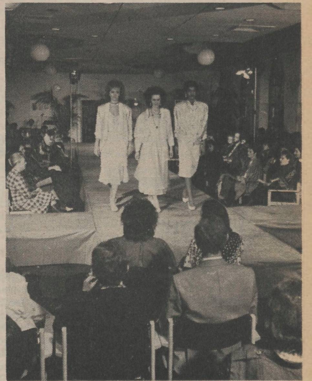
Beeldige toiletten in het restaurant, yuppies op zoek naar duppies, chinezen bij de japper, donkere wolven boven de witte wereld.