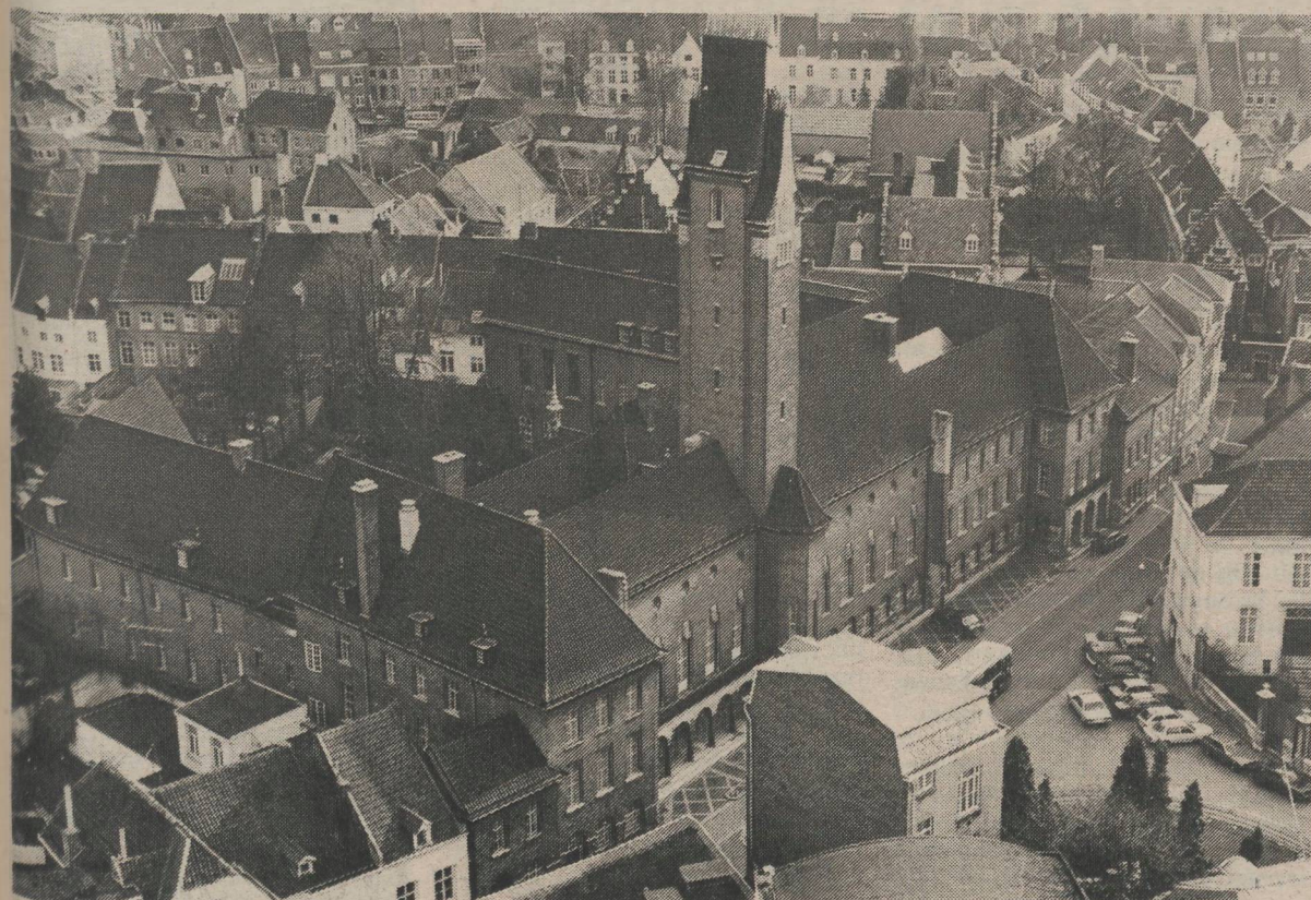
Het Oud-Gouvernement is een van de talrijke stenen des aanstoots waarop de Rekenkamer is gestoten tijdens haar onderzoek naar het beheer van de universiteit. De panden zouden door de provincie veel te goedkoop zijn verkocht aan de universiteit. Nieuwbouw zou veel economischer zijn geweest, maar dat wordt door de universiteit ontkend.

zevende jaargang, nummer 28 2 april 1987