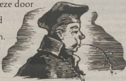
~ P R O E V E N ~

D e kenner. In gezelschap imponeert u iedereen als u na het nemen van drie bedachtzame slokken opmerkt: "Deze wijn heeft een bijzondere afdronk. Ongetwijfeld gemaakt van de Cabernet druif welke nog met de blote voeten geperst is door arbeiders die de dag daarvoor, bij warm weer, gypies heb-