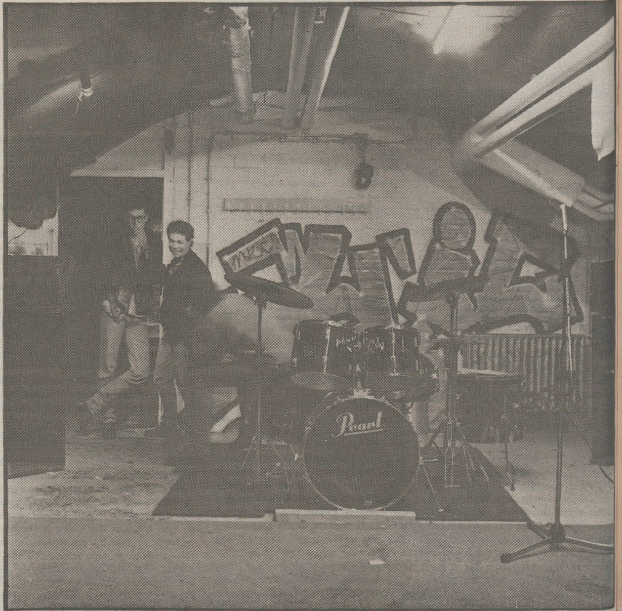
De oefenkelder van het Muziekkollektief aan de Capucijnengang