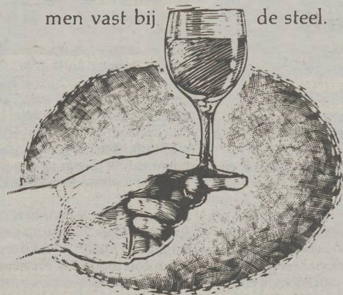
~ H E T G L A S ~

H et glas. Het glas houden men vast bij de steel.