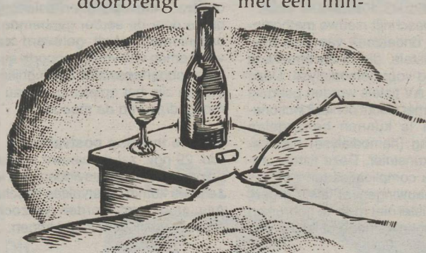
~ P R I J S ~

D e prijs. Goede wijn hoeft niet duur te zijn. Toch is er verschil tussen een ordinaire vin de table en bijvoorbeeld een Lafitte 1962. Treffend verwoord door barones Nadine de Rothschild : "Het drinken van deze Lafitte is als een hartstochtelijke nacht die je doorbrengt met een min-