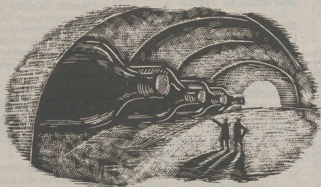
~ W I J N ~

W ijn. Geestmodaal vocht, te verkrijgen in de kleuren wit, rood en rosé. Wijn drinkt men om te genieten. Door het aanleggen van een wijnkelder belegt u dus in genot. Er is overigens niets op tegen om uzelf mondjesmaat dividend uit te keren.