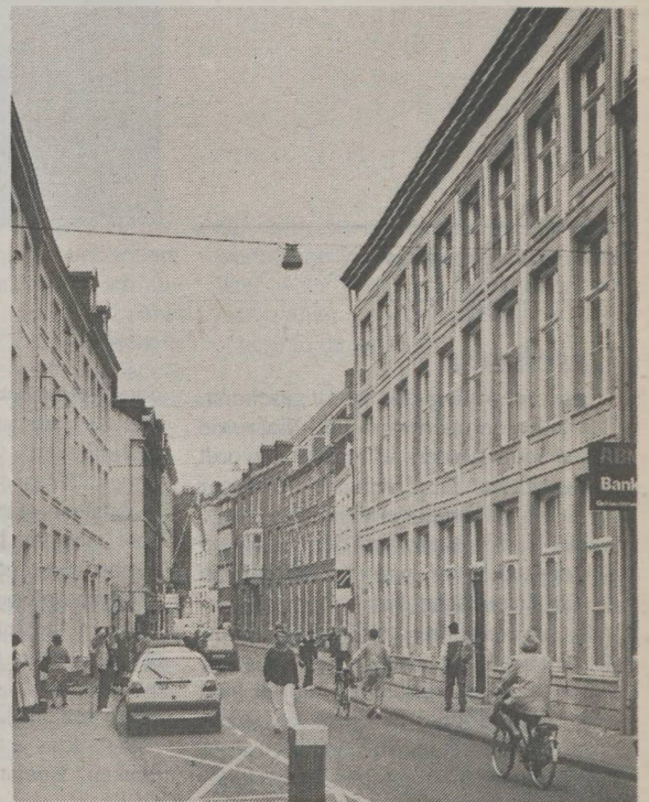
Het gebouw van Worldneth aan de Bredestraat