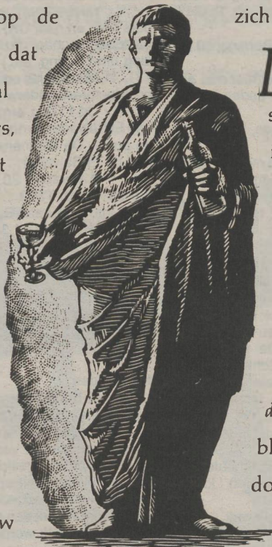
~ A D F U N D U M ~

H et bouquet. Laat de wijn in uw glas rondwalzen om de indruk te wekken dat u deze op kleur keurt. Steek vervolgens uw neus erin ( alleen in