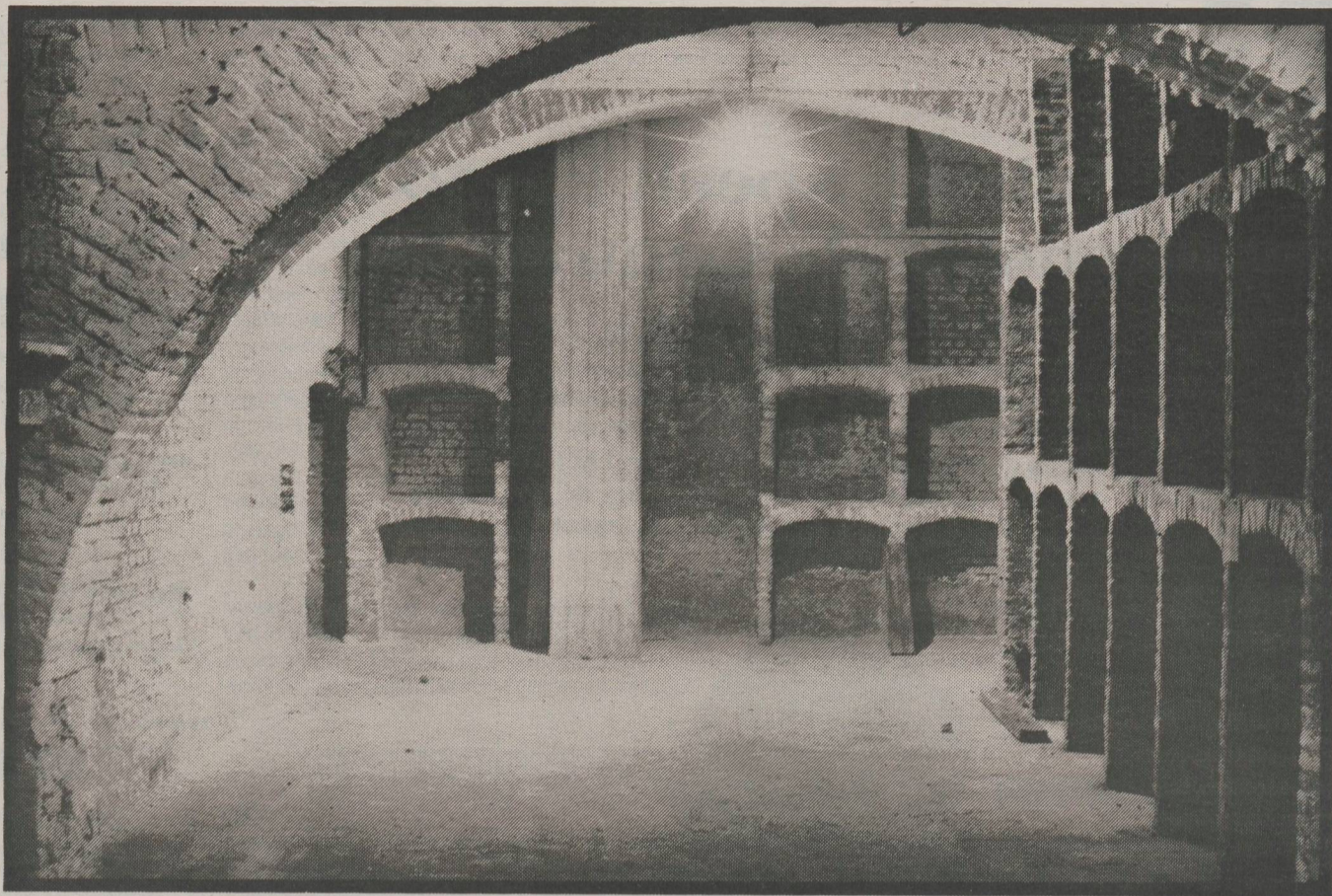
De voormalige kelders van wijnhandel Sauter aan de Gubbelstraat: straks studenten-sociëteit?