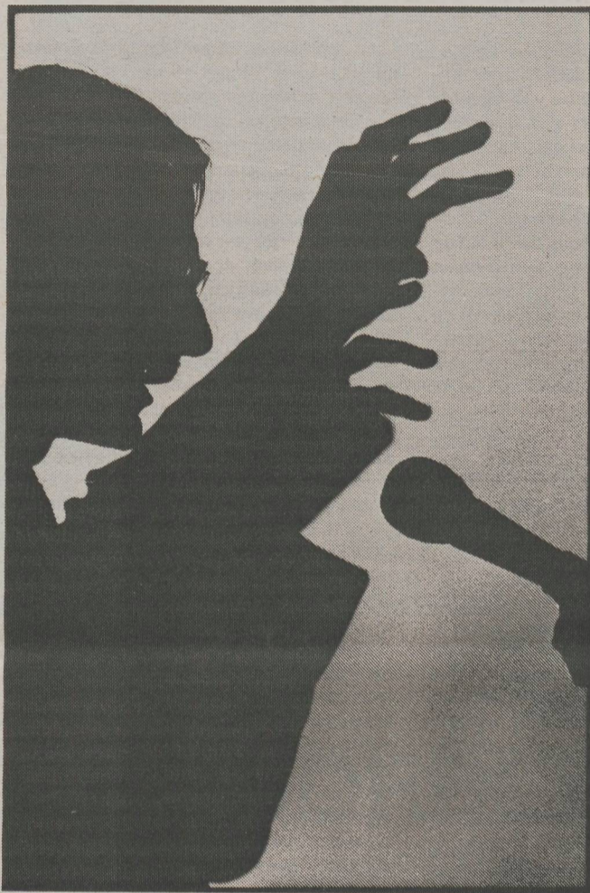
'Een interessante en aardige man, die ook goede boeken heeft geschreven, maar dat zegt nog niets over de kwaliteit van zijn ministerschap'

Inderdaad heeft Ritzen vorig jaar aan NWO meerjarige overhevelingen uit de universitaire onderzoeksgelden in het vooruitzicht gesteld van enkele tientallen miljoenen gulden. Korte tijd later, tijdens de onderhandelingen met de universiteiten over het hoofdlijnenakkoord, moest de bewindsman die belofte weer terugnemen. Dat is hem trouwens al vaker overkomen, dat ambitieuze plannen en voornemens een buitengewoon kort leven