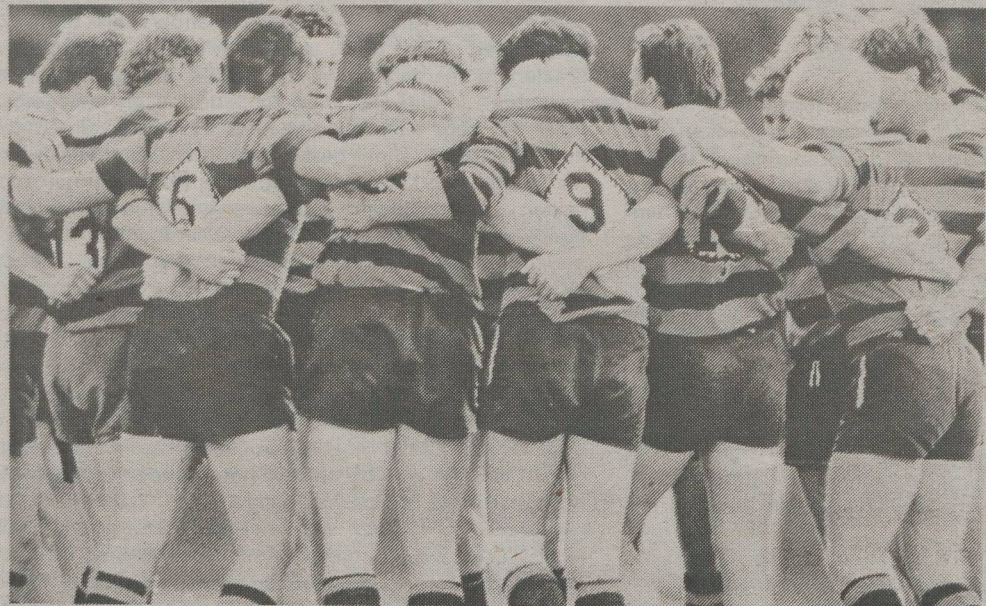
WIJ TREKKEN HET TEAMWORK DOOR