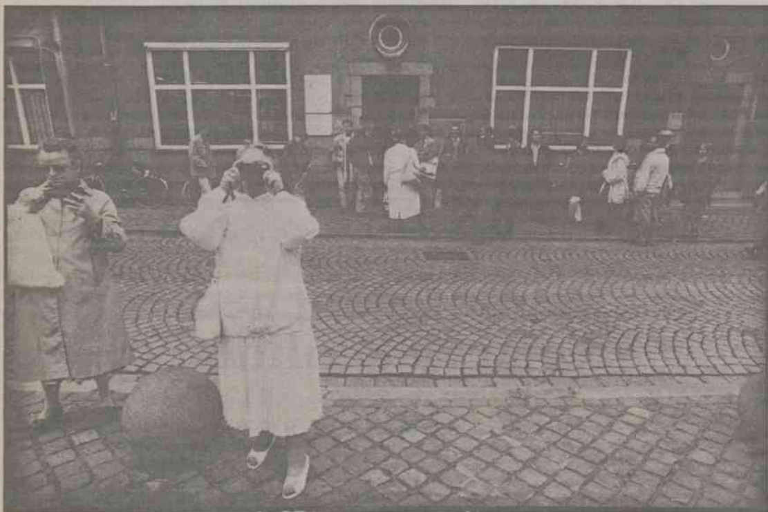
Dinsdagmorgen: de dagelijkse rij voor het kamerburo