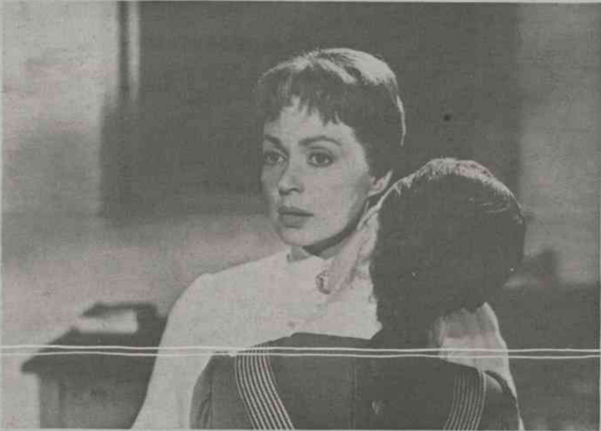
Opschudding in 1958: Romy Schneider kust Lilli Palmer in de hals. (Scène uit 'Mädchen in Uniform')

een 'remake' dan de tweede versie van 'Mädchen in Uniform'.