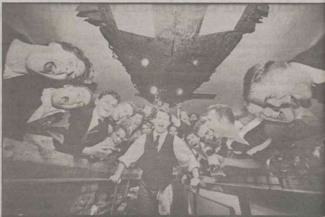
Ook Banalitas schreeuwt om erkenning, maar is (nog) te klein

Op aansluiting bij de MKvV zullen deze twee jonge verenigingen dus nog wel even